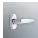
Poignée design exclusif TECHNAL