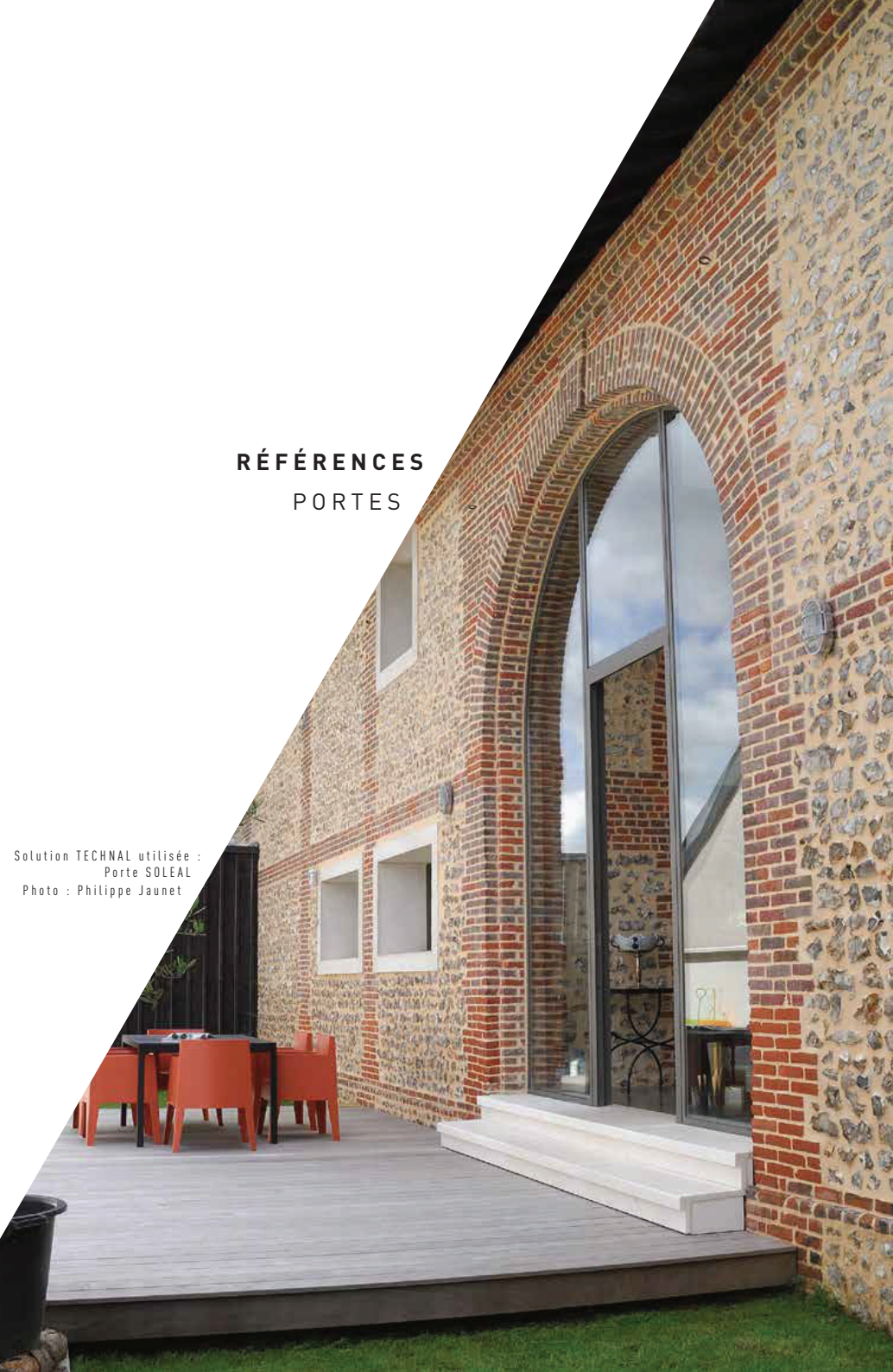
Solution TECHNAL utilisée : Porte SOLEAL