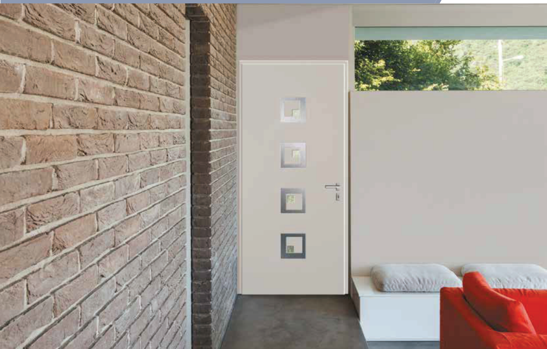
Solution TECHNAL utilisée : Porte MONOBLOC