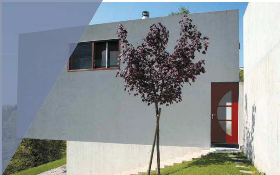
Solution TECHNAL utilisée : Porte MONOBLOC